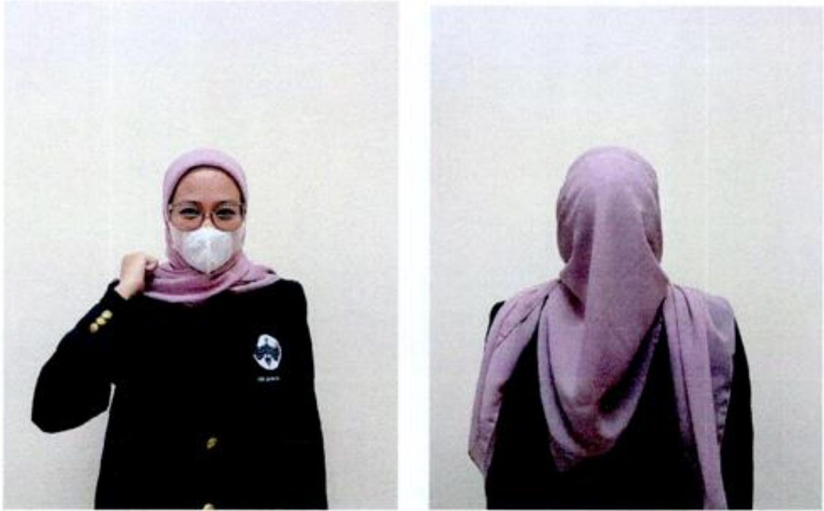
Gambar Jas Almamater tampak depan dan belakan